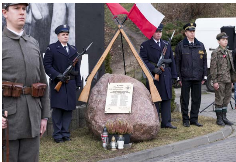
Wartę honorową pełnili służby mundurowe

Po okolicznościowych przemówieniach, odśpiewaniu hymnu państwowego, od-