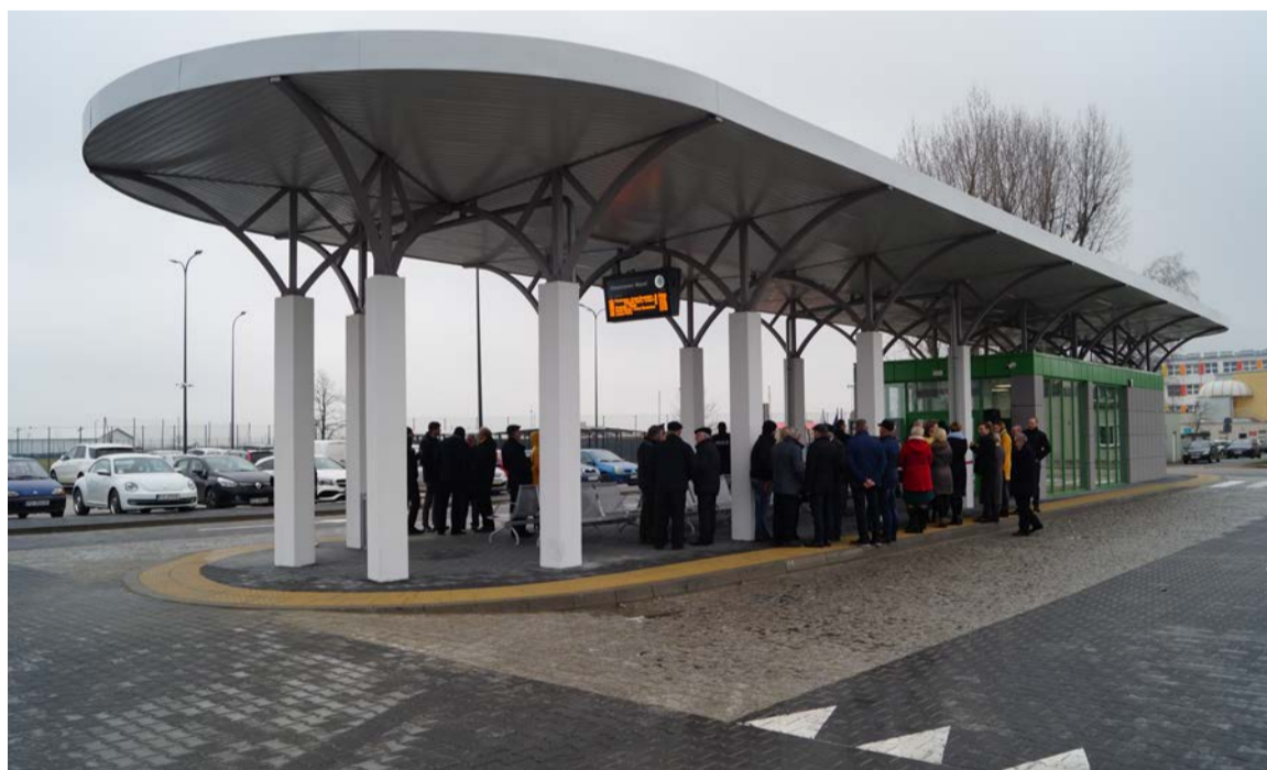
Inwestycja przyciąga uwagę nie tylko swoim nowoczesnym wyglądem, ale także udogodnieniami dla pasażerów

Projekt pn. Budowa zintegrowanego węzła przesiadkowego wraz z infrastrukturą towarzyszącą oraz inwestycje w zakresie publicznego transportu zbiorowego na terenie gminy Kleszczewo obejmuje budowę dwóch węzłów – w Kleszczewie i w Tulcach. Otwarty węzeł w Kleszczewie robi bardzo pozytywne wrażenie. Inwestycja przyciąga uwagę nie tylko swoim nowoczesnym wyglądem, ale także udogodnieniami dla pasażerów. Na węźle znajduje się ogrzewana poczekalnia, jak również toaleta. Bieżące informacje o godzinach odjazdów autobusów wyświetlane są na aktywnej tablicy umieszczonej na peronie. Kierowcy mogą zostawić swoje auta na parkingu przygotowanym dla 56 pojazdów. Jest oczywiście też miejsce dla rowerów, wiata pomieści 30 jednośladów. Inwestycja została zrealizowana z udziałem środków unijnych – z Wielkopolskiego Regionalnego Programu Operacyjnego, programu Zintegrowanych Inwestycji Terytorialnych w Miejskim Obszarze Funkcjonalnym Miasta Poznania. Projekt, oprócz budowy dwóch węzłów przesiadkowych przewiduje m.in. budowę dróg rowerowych o długości 0,838 km, pięciu obiektów P&R z 240 miejscami postojowymi, trzech obiektów B&R z 78 miejsca-