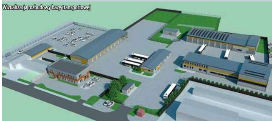
Wizualizacja rozbudowy bazy transportowej

Kwota zadania 11 718 276,90 zł Dofinansowanie 7 918 787,21 zł