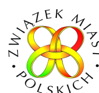
Związek Miast Polskich

Partnerem Strategicznym IV Kongresu Urbanistyki Polskiej jest