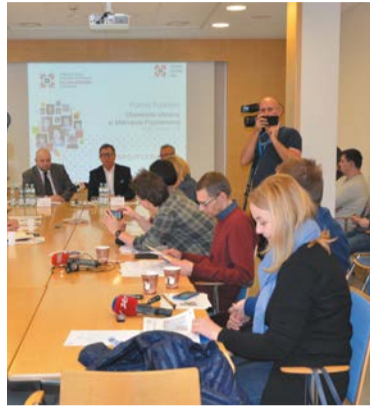
Wyniki badań zaprezentowano w Starostwie Powiatowym w Poznaniu

Na terenie metropolii Poznań przebywa ok. 100 tys. Ukraińców, z czego przeważającą część, bo aż 66 proc., stanowią mężczyźni. Największa liczba, bo aż 62,8 tys. osób, skupiona jest w powiecie poznańskim. Nasi wschodni sąsiedzi pracują w różnych sektorach.