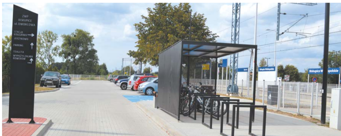
W 2018 roku uruchomiono m.in. węzeł przesiadkowy w Biskupicach

W czerwcu 2018 roku rozpoczęła działalność Poznańska Kolej Metropolitalna. Jej ważnym elementem jest budowa węzłów przesiadkowych, które znacząco wpłyną na integralność obszaru metropolii Poznań oraz zachęcą jej mieszkańców do rezygnacji z poruszania się samochodem na rzecz komunikacji zbiorowej. W ramach węzłów przesiadkowych tworzone są m.in.: parkingi dla samochodów i rowerów, drogi dojazdowe, ścieżki rowerowe, chodniki, przystanki autobusowe i tramwajowe oraz systemy informacji pasażerskiej. Już teraz mieszkańcy metropolii Poznań mogą korzystać z 20 oddanych do użytku węzłów. W ich ramach powstało 31 parkingów Park & Ride z 1682 miejscami postojowymi dla samochodów, 9 parkingów Kiss & Ride oraz 28 parkingów B&R z miejscami postojowymi dla 655 rowerów. Ze środków ZIT dofinansowano również zakup 15 nowoczesnych autobusów. Wartość wybudowanych węzłów to 120 mln zł, z czego 95 mln zł stanowi dofinansowanie ze środków UE w ramach ZIT. Najpóźniej do 2023 roku powstaną łącznie 54 węzły przesiadkowe.